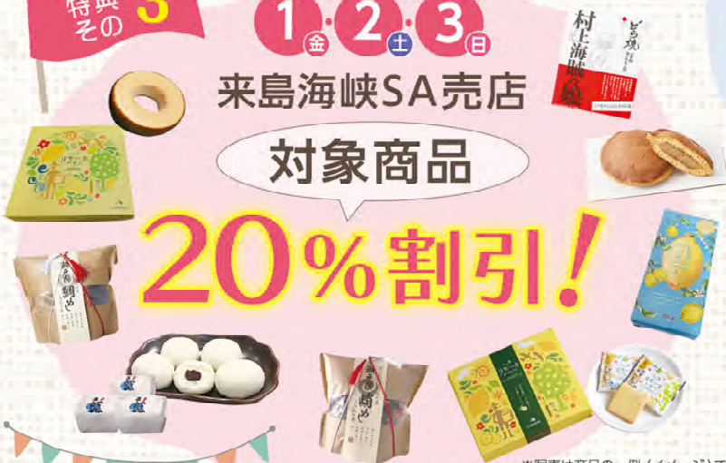
※写真は商品の一例(イメージ)です。